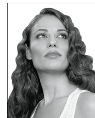
Easily creates body, texture and waves